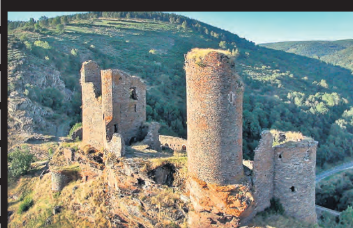
Le château comme on ne l'avait jamais vu...

Un drone ("faux bourdon" en anglais) est un aéronef télécommandé qui emporte une charge utile. Auparavant uniquement destinés à des missions de surveillance, de renseignement, de combat ou de transport, les drones étaient en général utilisés au profit des forces armées. De plus en plus souvent, ils se découvrent des applications civiles, voire de loisirs. La prise de vues aériennes par drone est très réglementée. Pour faire voler appareils photo et caméras, les télé-pilotes doivent être titulaires d'un Manuel d'Activité Particulière et justifier de tous les diplômes, certificats, déclarations, autorisations et assurances professionnelles, exigés par la Direction Générale de l'Aviation Civile, la préfecture et le ministère des transports.