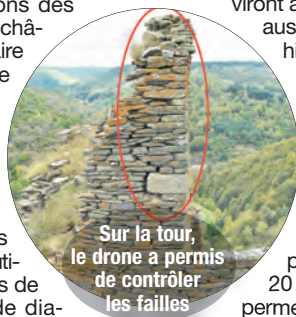
Sur la tour, le drone a permis de contrôler les failles

Je réalisais des images à Saint-Julien-du-Tournel lorsque j'ai rencontré monsieur Bouteille. Il m'a alors expliqué les problèmes de dégradations des parties supérieures du château et son projet de faire monter un échafaudage le long des tours afin d'évaluer les dégâts. Une entreprise pharaonique, vu la difficulté pour accéder au site et pour sécuriser une telle installation. Nous avons rapidement envisagé d'utiliser un drone de prises de vues aériennes afin de diagnostiquer l'état des murs abîmés dans leur partie la plus inaccessible : une solution bien plus rapide à mettre en place et beaucoup plus économique.