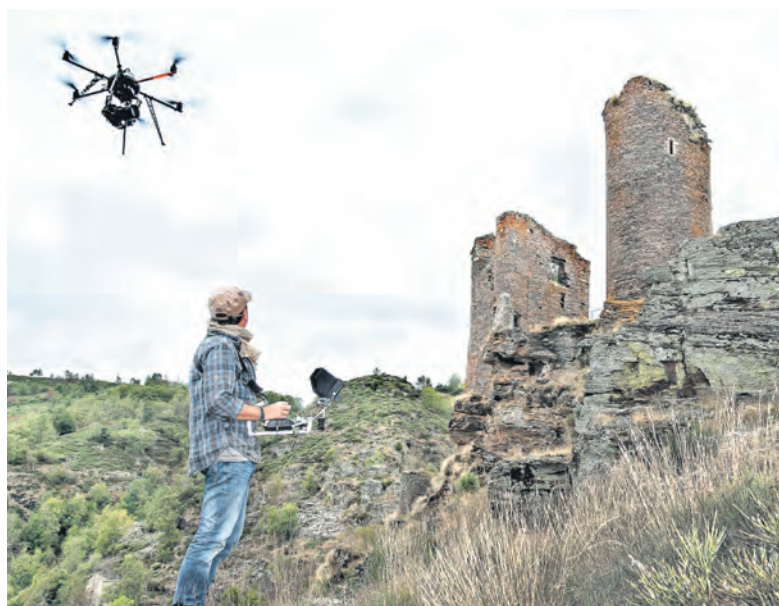
Vision anachronique d'un étonnant drone aux élytres de coléoptères partant à l'assaut des murs séculaires de la forteresse du Tournel