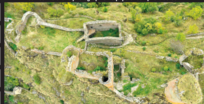
Tel un pétroglyphe, le château signe de son empreinte le paysage du Tournel